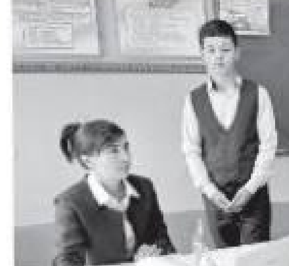
Синф раҳбарлари ва ўқувчилари ўқув-тарбия ишларида фаол иштирок этаётган ҳолатда.

Дунё ва давр шиддат билан ўзгармоқда. Бугун ҳар қандай таълим масканида ҳам бундай ҳолатлар юз бермоқда.