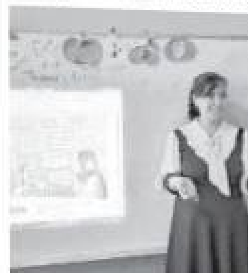
Агар илгари педагогнинг маънавияти ҳақида сўз қилинганда...

Бугун таълим тизимини юртимизда тартибга солиш билан аниқлаштирилган ҳолатда ўқувчиларнинг ақлини рўқибдириш билан бир вақтда уларнинг ҳаётини яқинлаштиришга ҳам эътибор қаратмоқдалар.